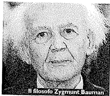
Il filosofo Zygmunt Bauman

generato altrove; o trovare modelli di gestione di flussi migratori - e della multiculturalità da essi indotta - provocati da una crescente pressione esterna». In questo l'Europa è per certi